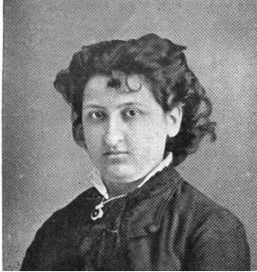
Aletta in 1878